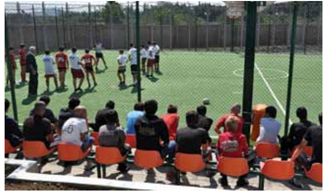
საქართველოს რაგბის კავშირის ფოტოები

2011 წელს, საქართველოს რაგბის კავშირის, სას-ჯელალსრულების, პრობაციისა და იურიდიული დახმარების საკითხთა სამინისტროსა და გაეროს ბავშვთა ფონდის ერთობლივი ინიციატივის ფარგლებში, თბილისში ავჭალის არასრულწლოვანთა სპეციალურ დაწესებულებაში დაინერგა რაგბის სასწავლო პროგრამა.