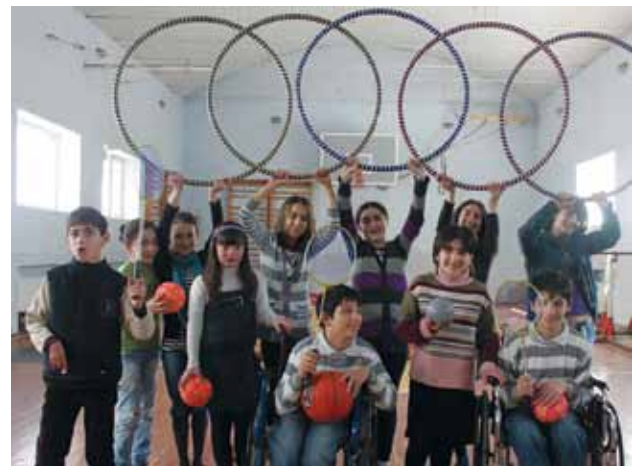
განათლებისა და მეცნიერების სამინისტროს ფოტოები